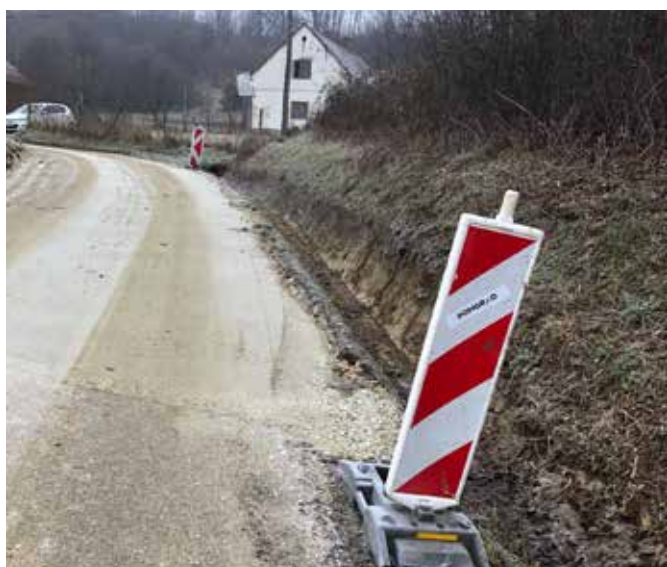
Cestno podjetje MS sanira poškodovano vozišče v Kovačevcih – javna pot Dolžine.