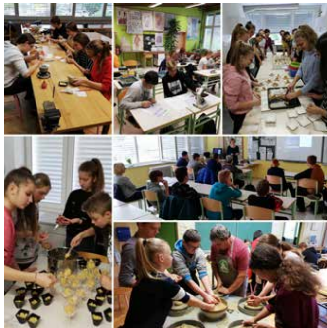
Učenci navdušeno sodelujejo v delavnicah.

V sredo, 6. 11. 2019, so našo šolo obiskali učenci 9. razredov Osnovne šole Vojnik iz Celja. V sklopu naravoslovnega dne so jim strokovni delavci naše šole pripravili štiri delavnice – naravoslovno delavnico iz mikroskopiranja, lončarsko delavnico z izdelovanjem lončenih posodic, kuharsko delavnico, pri kateri so pripravili jabolčni zavitek v kozarcu in dödole, ter delavnico prekmurskega narečja, v kateri so se učenci s pomočjo kviza preizkusili v razumevanju našega narečja. Z obiskom naše šole so učenci Osnovne šole Vojnik začutili utrip življenja in dela na naši šoli ter širili svoja obzorja o poznavanju naših običajev in kulinarike.