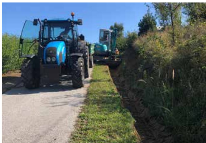
Izkop jarkov na javni poti - Kovačeva graba v Vidoncih do H.Št. 124