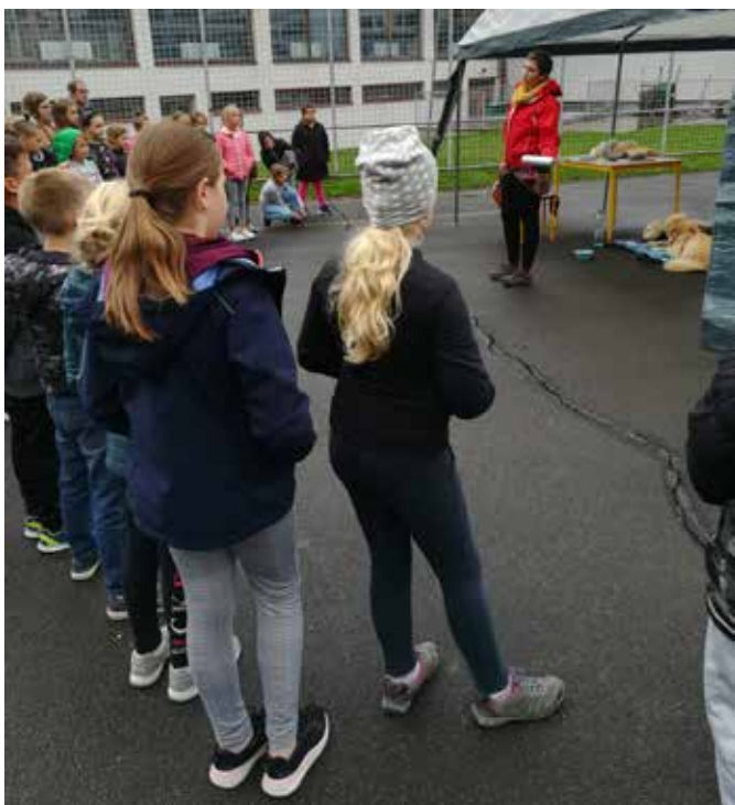
Obiskalo nas je Društvo za zaščito živali Pomurja.

Teden otroka je letos potekal od 7. do 13. oktobra. V tem tednu smo izvedli nekatere dneve dejavnosti. Učenci 4. in 5. razreda so obiskali Mursko Soboto, kjer so spoznavali skrivnosti muzeja in galerije in se srečevali z drugačnostjo, ko so obiskali Center Sonček v Murski Soboti. Učenci prve triade so ustvarjali na temo jesenskih plodov. V tem tednu so si učenci od 1. do 4.