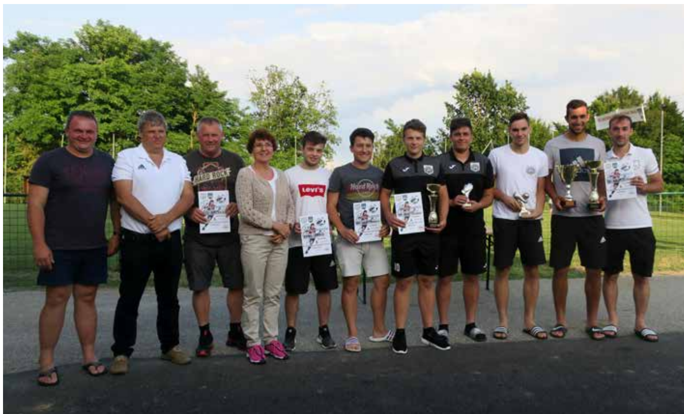
Udeleženci turnirja

Mihaela Žökš, dipl. upr. org. Strokovna sodelavka za družbene dejavnosti