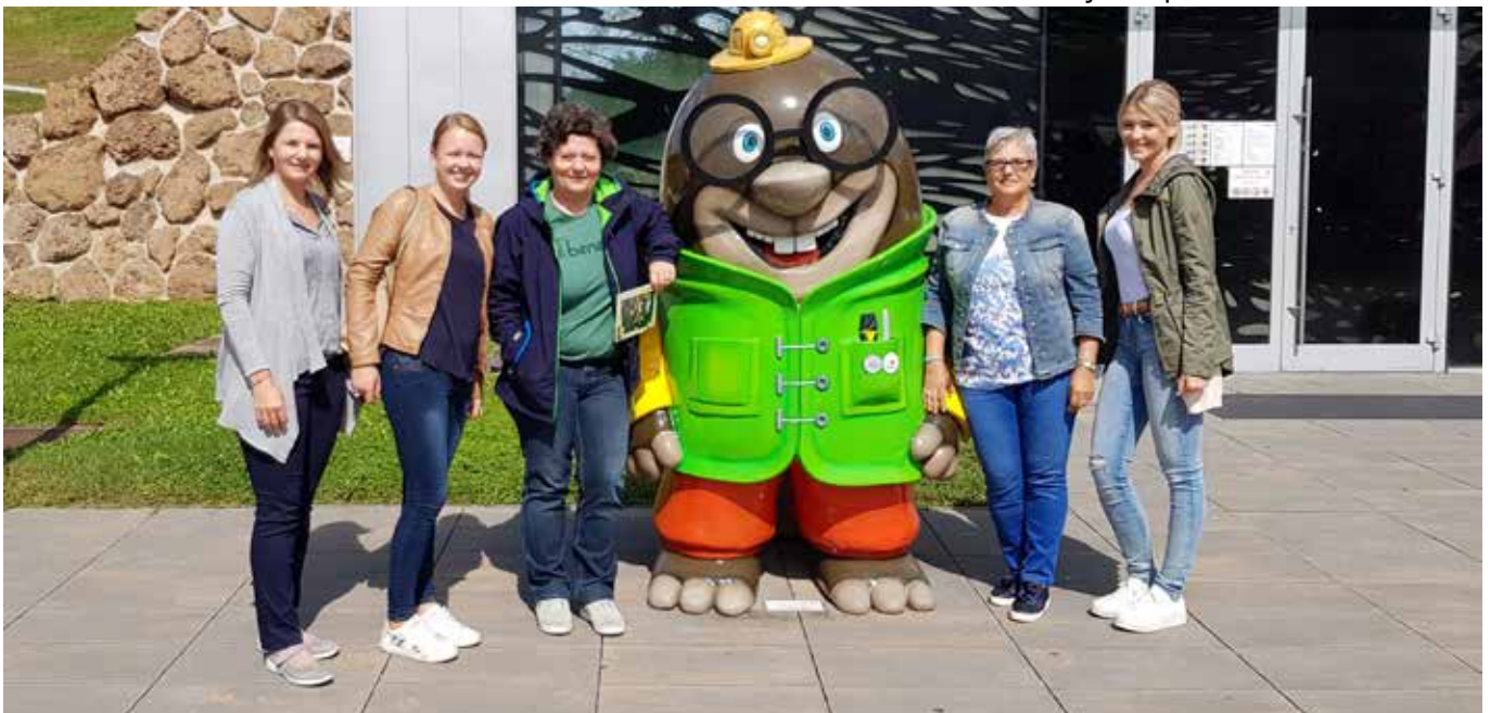
S predstavniki Turistične zbornice Bad Radkersburg