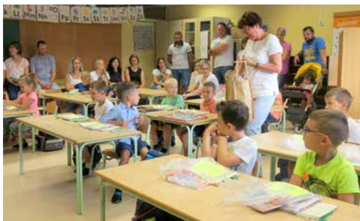
Županja se je razveselila novih prvošolčkov.