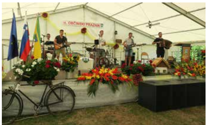
Na koncu je sledila zabava s skupino Prestiž