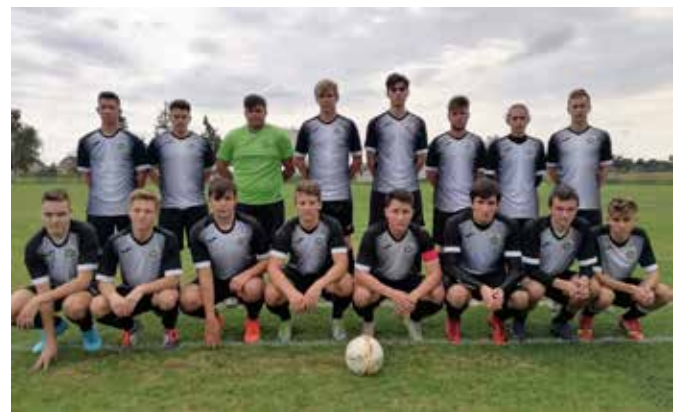
Mladinci NK Grad