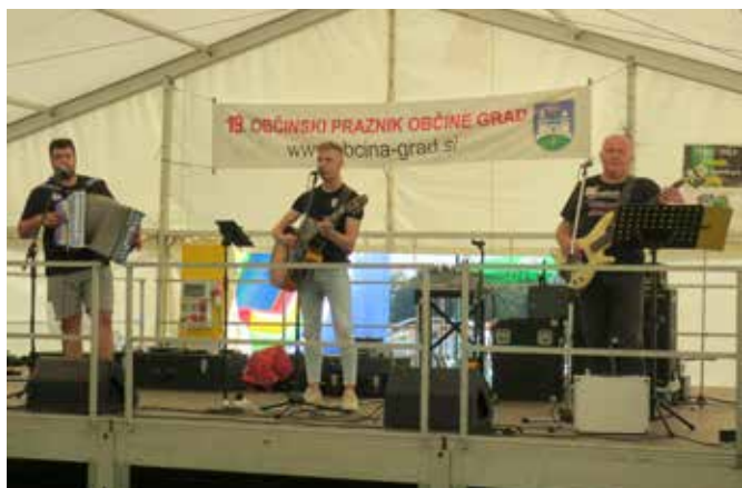
Med peko so igrali domači fantje

Mihaela Žokš, dipl. upr. org. Strokovna sodelavka za družbene dejavnosti