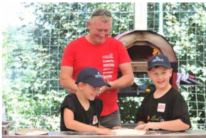
Mladi pod budnim očesom »picopeka Slovenije 2018«