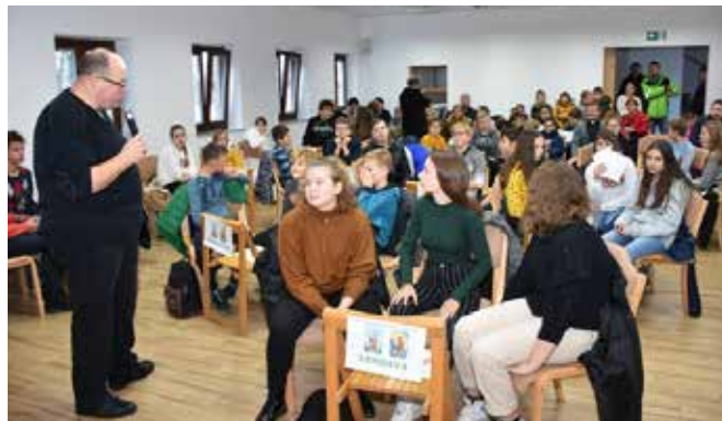
Škofija Murska Sobota in Župnija Grad