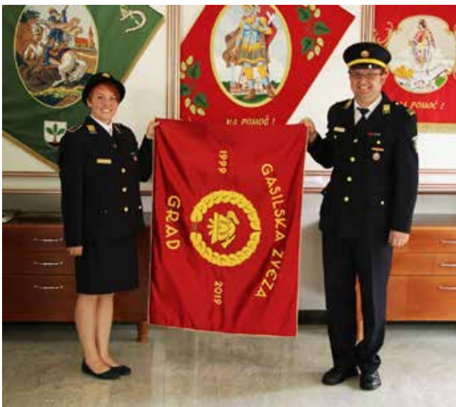
V podjetju Ercigoj sta predsednik in tajnica GZ Grad prevzela nov prapor.

V soboto, 3. 8. 2019, je v Motovilcih potekala slavnostna prireditve ob 20. obletnici delovanja ter razvitje prvega prapora GZ Grad.