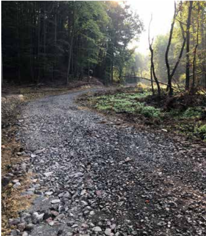
Letos sta se uredili gozdni cesti v Vidoncih in Motovilci