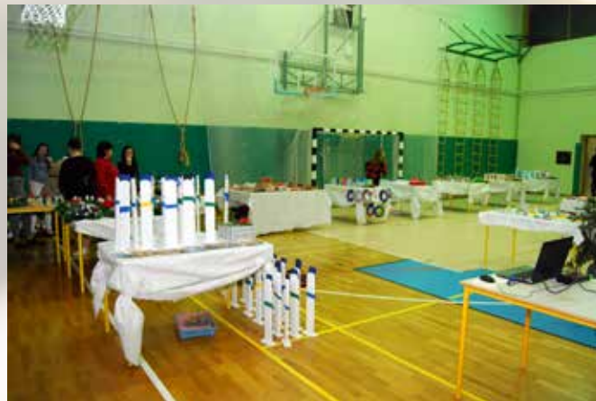
Na stojnicah so bili božični izdelki