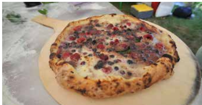
Izbira pic je bila pestra.