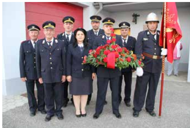
Slovesnost se je pričela že en dan prej, ko so se spomnili vseh gasilcev, ki so že odšli v Večnost