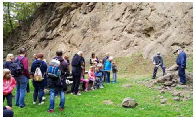
Živa pripoved o delu v kamnolomu je navdušila obiskovalce.

ZUKD Grad vsako leto sodeluje na Dnevih evropske kulturne dediščine – DEKD. Osrednja tema letošnjih dni je bila »Dedišči-