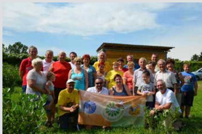
Tam, kjer sonce vzhaja in zahaja in kjer pomladna sapica zaveje med drevesi, tam je naše lepo Goričko. Skupaj smo praznovali SVETOVNI DAN ČEBEL.