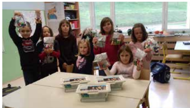
Učenci so se novih pridobitev zelo razveselili.

Na naši šoli se v sklopu projekta Popestrimo šolo že drugo leto izvaja konstruktorski krožek. Lani je sodelovala le ena skupina učencev, letos sta že dve. Ker je za nabavo ustreznih učnih pripomočkov potrebno veliko sredstev, smo zato, da bi