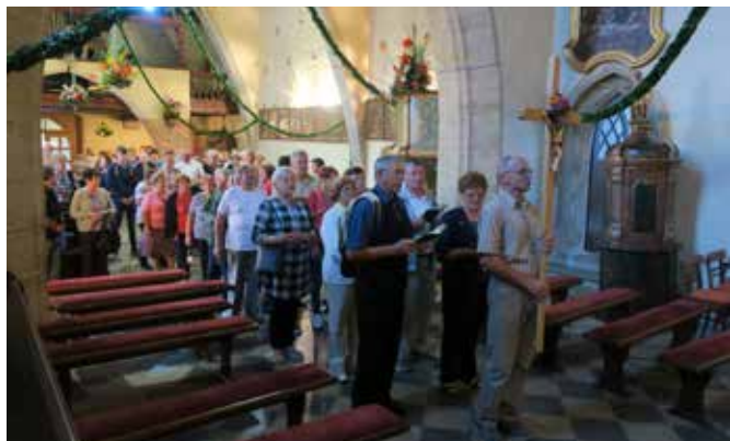
Romarji iz Vidoncev, ki so na predvečer Marijinega praznika peš priromali k Mariji.