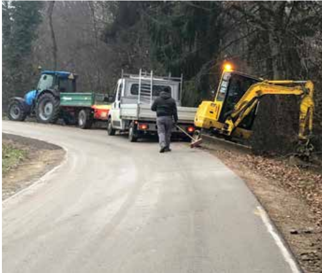
Delavci RO urejajo bankine na javni poti – »Mlinarov vrej« v Vidoncih.