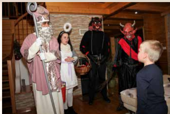
Sv. Miklavž preveri, če znamo moliti