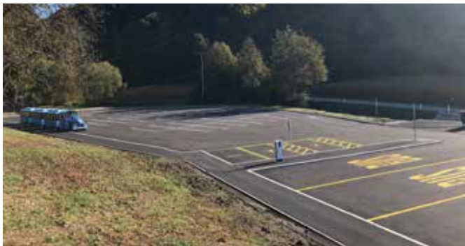
Izvedba zadnjega sloja asfalta in uredila se je horizontalna in vertikalna signalizacija. V sklopu izgradnje parkirišča se je uredila tudi brežina potoka, kamor se izteka meteorna voda s parkirišča.