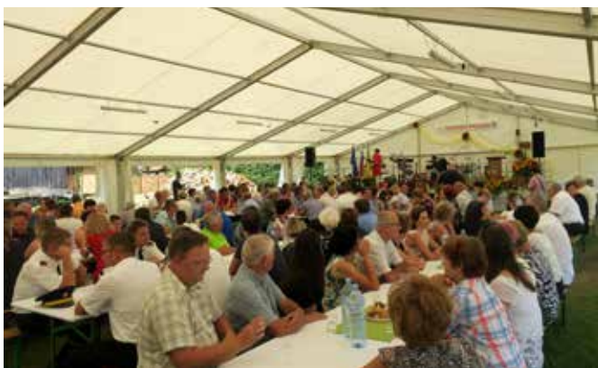
Vsi skupaj za skupno dobro