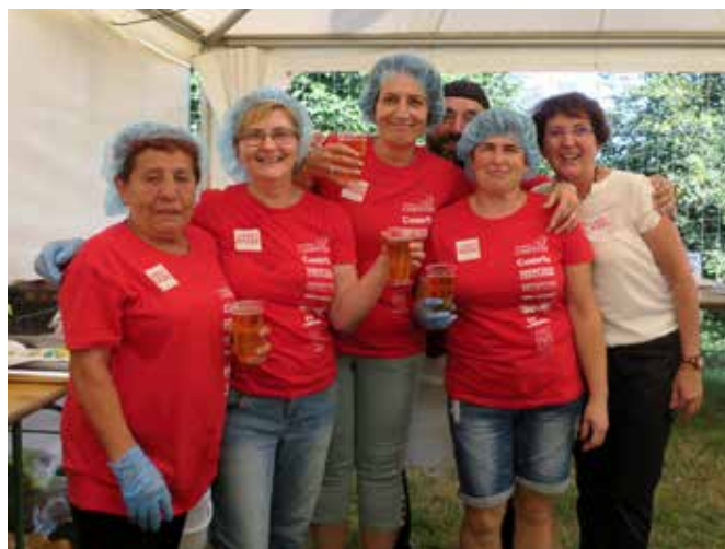
Veselje med ekipo ŠD Kovačevci

Mihaela Žokš, dipl. upr. org. Strokovna sodelavka za družbene dejavnosti