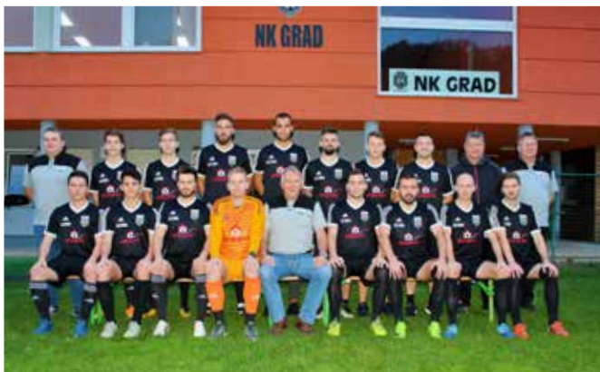
Članska ekipa NK Grad