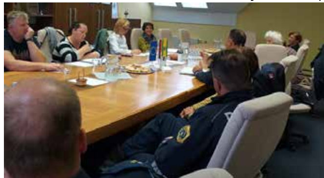
Mozaik, društvo za socialno vključenost, so.p.

Dolgoletna praksa in izkušnje pri delu z različnimi družbenimi skupinami potrjujejo dejstvo, da le skupaj in povezani lahko najdemo učinkovite rešitve v hitro spreminjajoči in starajoči se družbi. Storitve je potrebno hitro in učinkovito nuditi tam, kjer so ljudje doma, da bodo v svojem okolju lahko čim dlje ostali in tam tudi kvalitetno živeli. V podporo temu v društvu Mozaik takšne programe in projekte tudi izvajamo. Ob tej priložnosti se zahvaljujemo Občini Grad za sprejem in možnost izvedbe omenjenih delavnic.