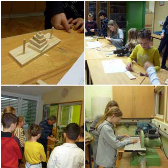
Učenci pri izdelavi Hanojskega stolpa

(risali, žagali, vrtali, brusili ipd.) leseno miselno igro Hanojski stolp, v kateri so preizkusili svoje sposobnosti. Z izmenjavo kontaktnih podatkov so si na koncu obljubili, da bodo ostali v stiku in se morda v prihodnje spet srečali.