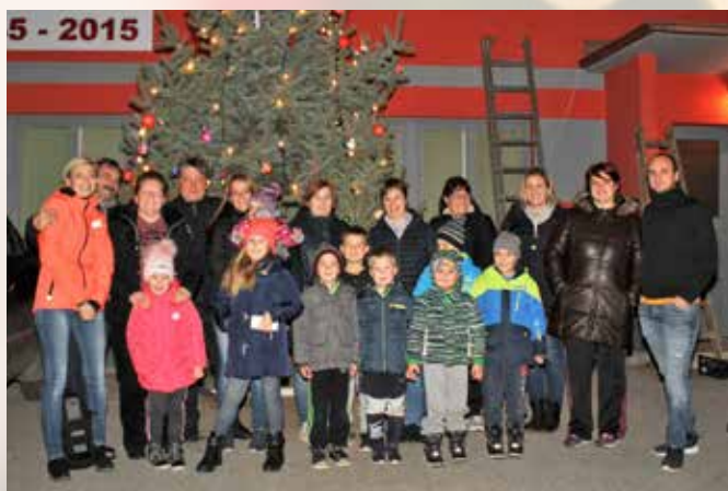
Skupno okraševanje jelke