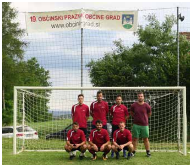
Zmagovalci turnirja 2019, ekipa ŠRD Dolnji Slaveči

V nedeljo, 14. 7. 2019, je na nogometnem igrišču v Kruplivniku potekal tradicionalni občinski turnir v malem nogometu za prehodni pokal Občine Grad. Prireditelj je potekala v okviru 19. občinskega praznika Občine Grad. Organizacijo je letos prevzelo ŠD Kruplivnik. Turnirja se je udeležilo osem ekip športnih društev iz občine.