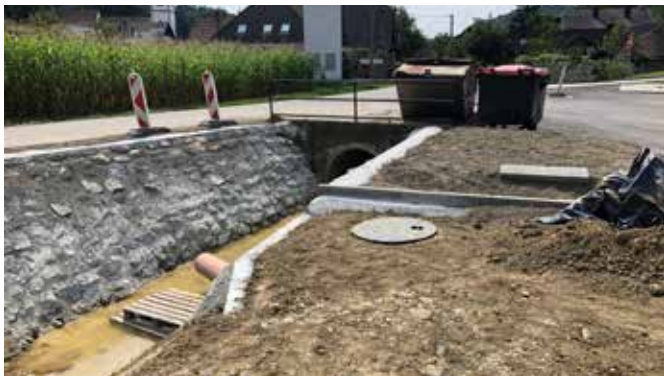
Nadaljevanje del na parkirišču pri Vulkaniji