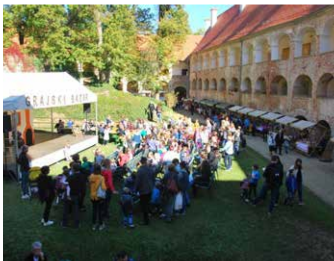
Besedilo povzela: Štefanija Fujs

Ponudbo imetnikov Kolektivne blagovne znamke Krajinski park Goričko je dopolnila kulinarčna ponudba Gostilne Pizzerie Raj od Grada, obiskovalci prireditve pa so se s turističnim vlakcem Oli lahko zapeljali tudi do Vulkanije.