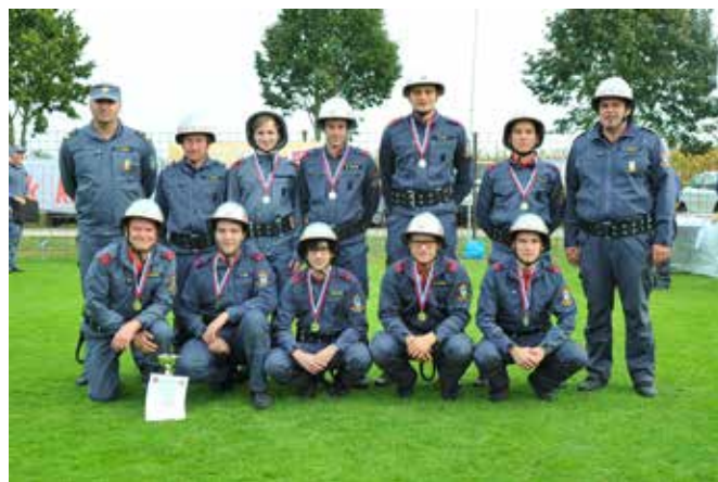
PGD Motovilci člani A, REGIJSKI PRVAKI