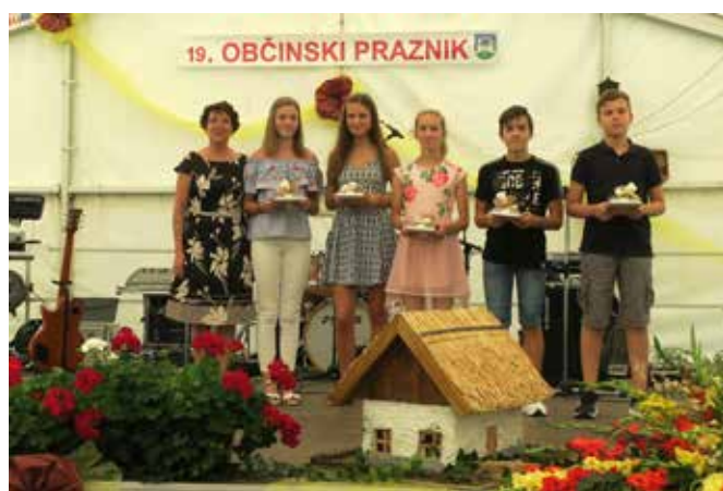
Županja je nagradila uspešne učence.