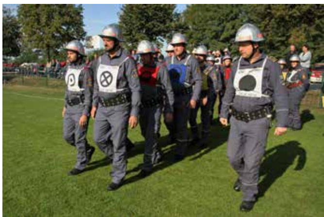
PGD Dolnji Slaveči člani A

Pomerili so se v vaji z motorno brizgalno po pravilih CTIF, štafeto z ovirami ter v vaji razvrščanja. Motovilci člani B so dosegli 8. mesto. Člani A PGD Dolnji Slaveči so končali na odličnem 5. mestu, člani A PGD Motovilci pa so postali regijski prvaki in se uvrstili na državno tekmovanje, ki bo