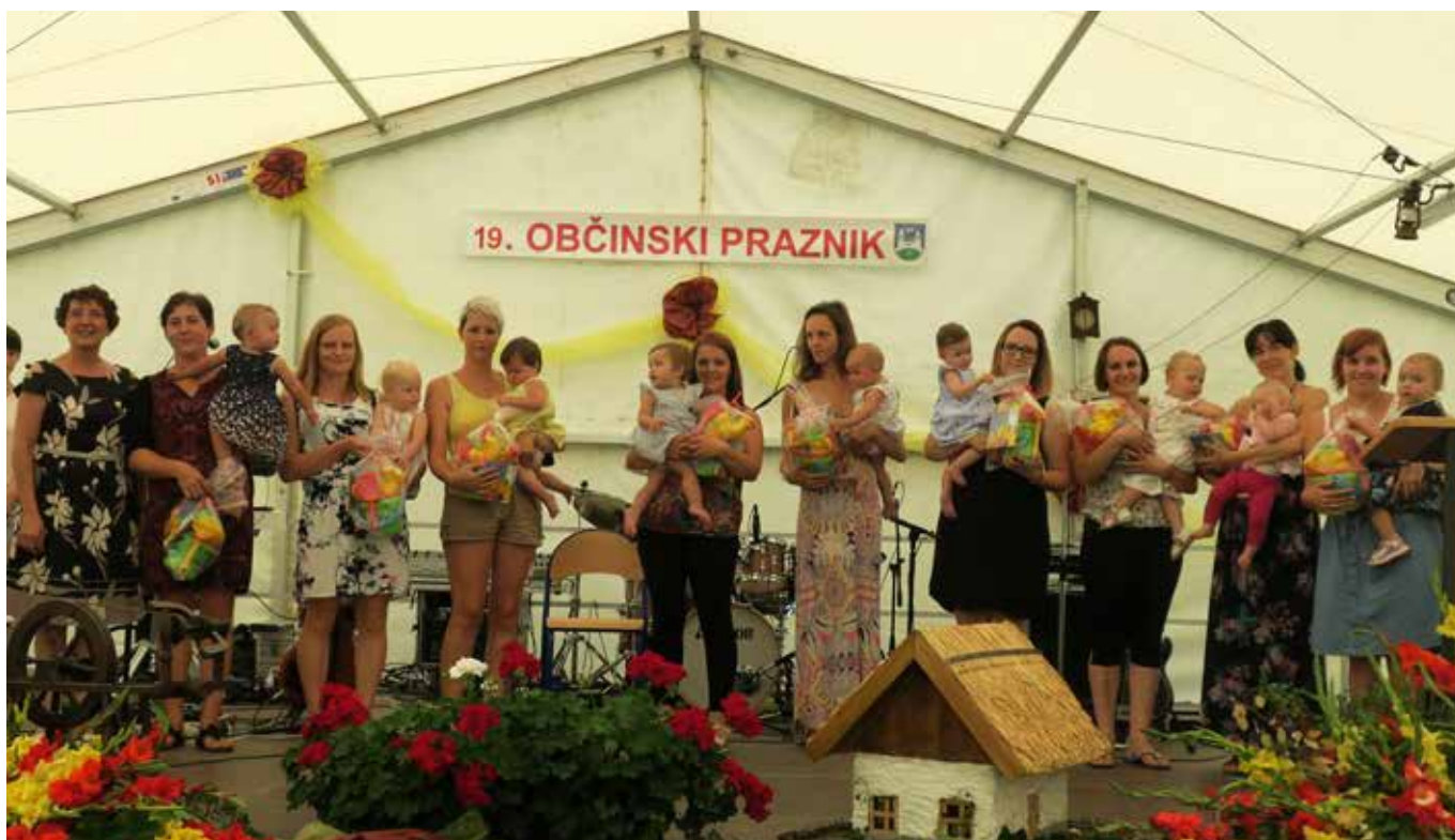
Prisotne mamice z novorojenci v letu 2018