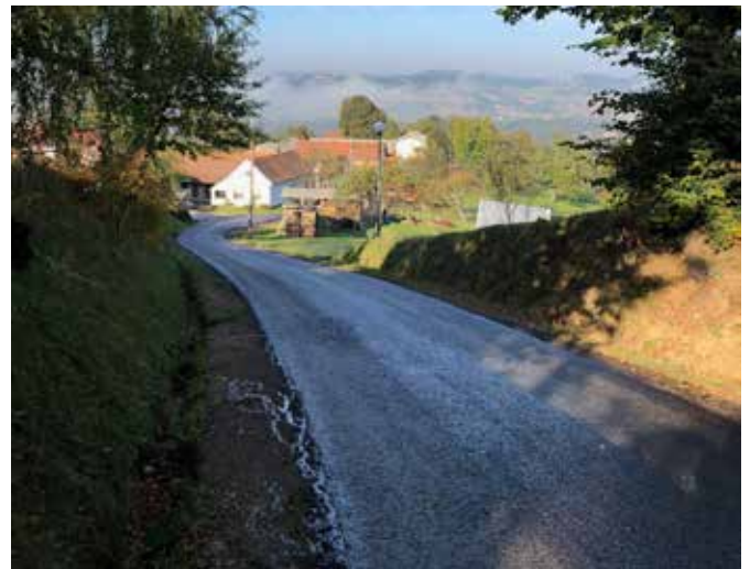
Investicijsko vzdrževanje ceste Cmorov breg v Motovilcih z ureditvijo javne razsvetljave