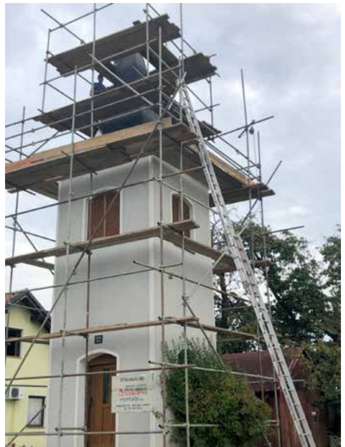
Obnova strehe na zvoniku v Kovačevcih - S strani Režijskega obrata Občine Grad se je tudi obnovila - prebarvala fasada.