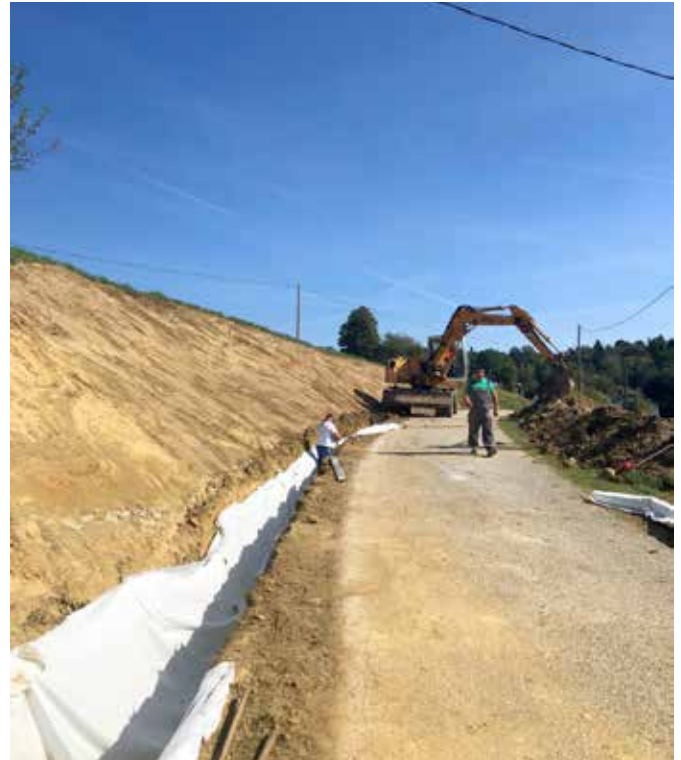
Izvedba globoke drenaže za zajem in odtok vode iz plazu s polaganjem kanalet na javni poti v Vidoncih (h.Št. 141)