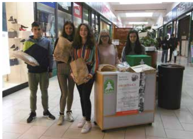
Učenci zbirajo prostovoljne prispevke.