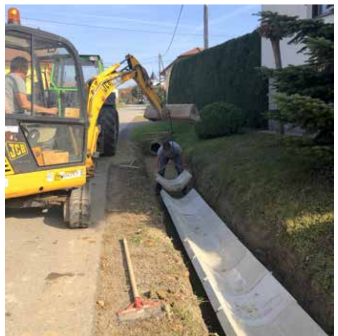
Polaganje kanalet v Motovilcih