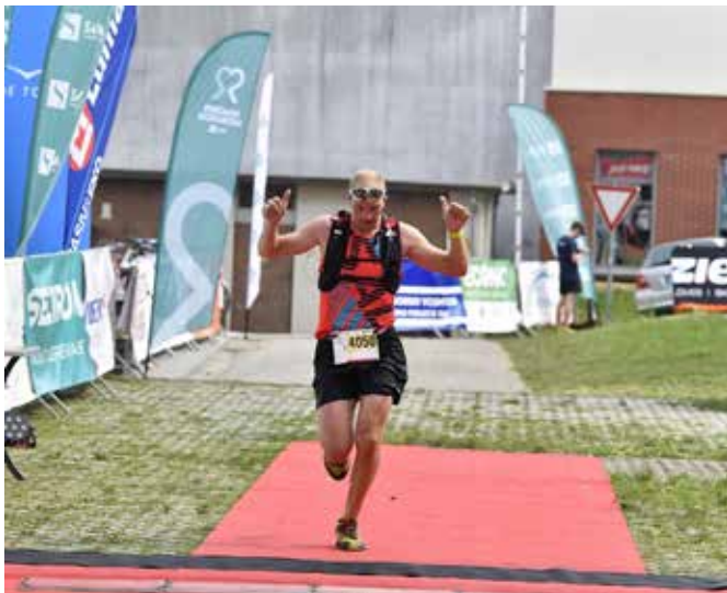
Pohorje Ultra Trail 2019

Tomažu se zahvaljujemo za pogovor ter mu želimo veliko nadaljnjih tekaških uspehov, uresničitev zadanih ciljev ter zdravja, osebnega zadovoljstva in družinske sreče.