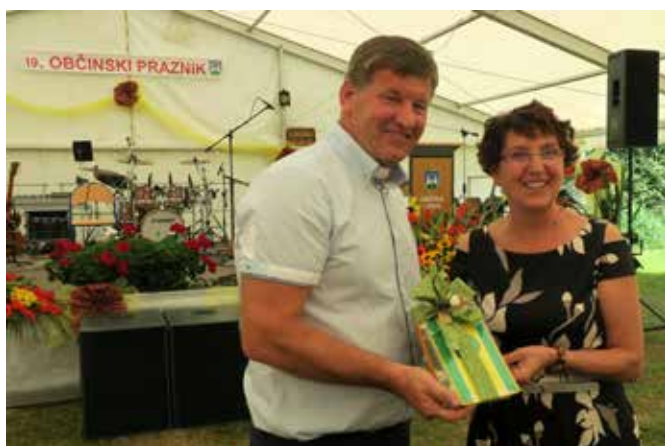
Slavostni govornik je bil g. Franc Bogovič, poslanec Evropskega parlamenta