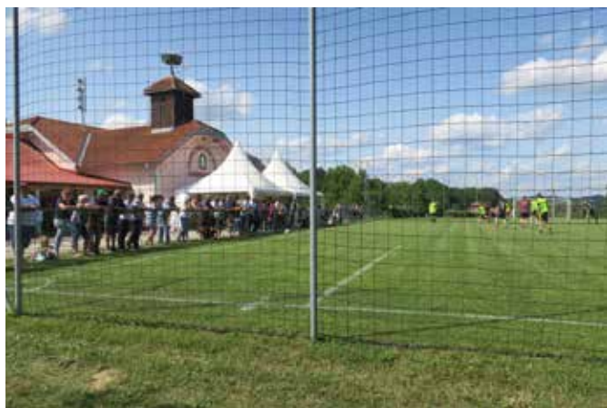
Občinski nogometni turnir v Kruplivniku