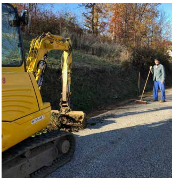
Urejanje odvodnjavanja na sabotinovi cesti v Radovcih