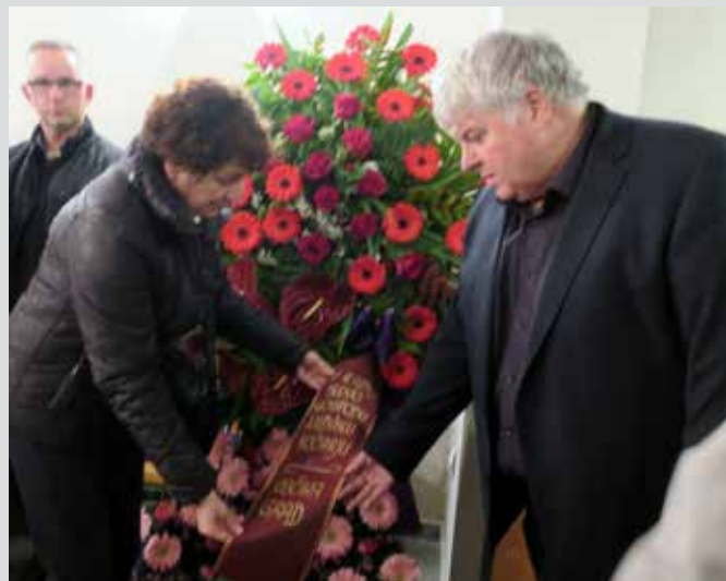
HVALA ZA VSE, KAR STE STORILI ZA NAŠO LOKALNO SKUPNOST. POČIVAJTE V MIRU.