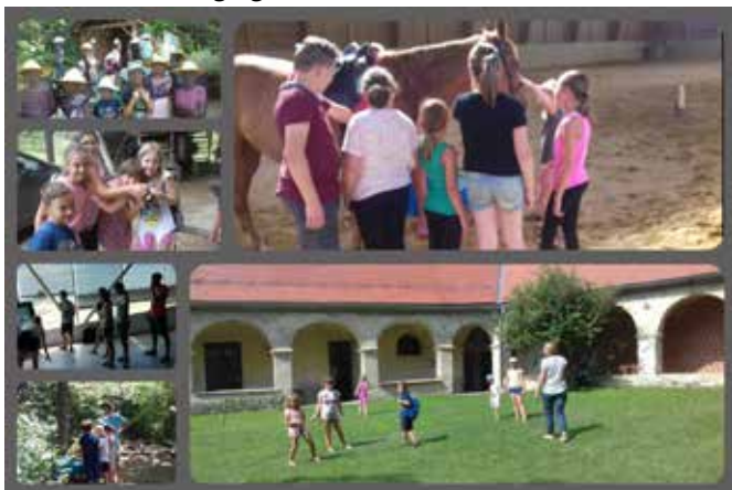
Počitnice so bile pester.