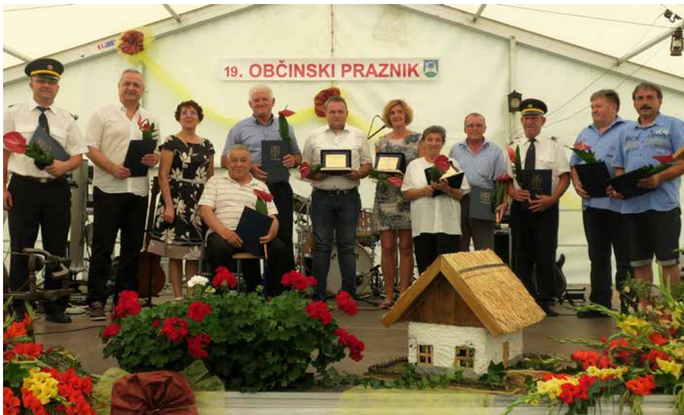
Dobitniki plaket in priznanj Občine Grad 2019 z županjo

PRAZNIK ZA LJUDI, KI NIMAJO LE ŽELJA, TEMVEČ JIH KRASIJO DEJANJA