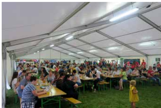
Obiskovalci 1. Fest pice