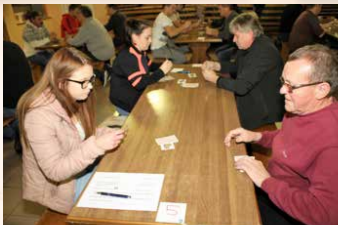
Tekmovanje v kartanju