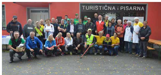
Pohodniki Graščakove poti pred Info pisarno v Radovcih