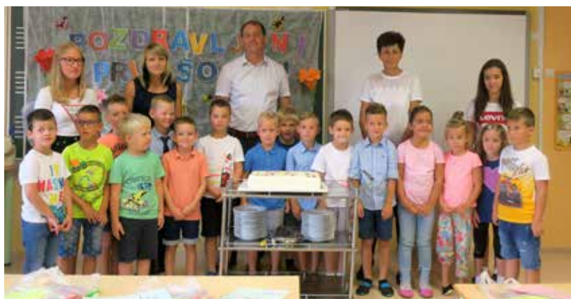
Prvošolčkom želimo, da bi v šolo radi hodili, se v njej dobro počutili in se veliko novega naučili.

Brezskrbno poletje se je končalo in šolarji so sedli v šolske klopi. Posebej vznemirljivo in nepozabno doživetje je bilo za 16 prvošolčkov, ki so v občini Grad prvič prestopili prag šole in prvič zaslišali šolski zvonec, pozdravila pa jih je tudi županja Cvetka Ficko, ki je učiteljem, učencem ter staršem zaželela obilo uspeha, sreče in varnosti v novem šolskem letu. Kot je dejala, je prvi šolski dan vedno nekaj posebnega za učence, ki prvič prestopijo šolski prag in si ga zapomnijo za celo življenje, tako tudi za starše in občino. Otrokom je povedala, da je poleg učenja v šoli pomembno tudi pri-