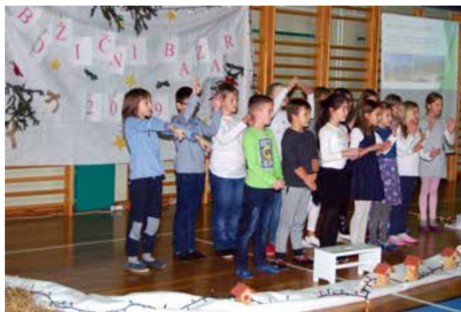
Učenci in kolektiv OŠ Grad

Naj se tudi vam izpolni vsaj katera skrita želja!