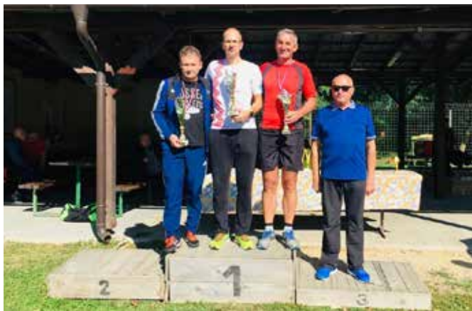
Zaključek Pomurskega pokala Beltinci 2019

Po pogovoru zapisala: Štefanija Fujs