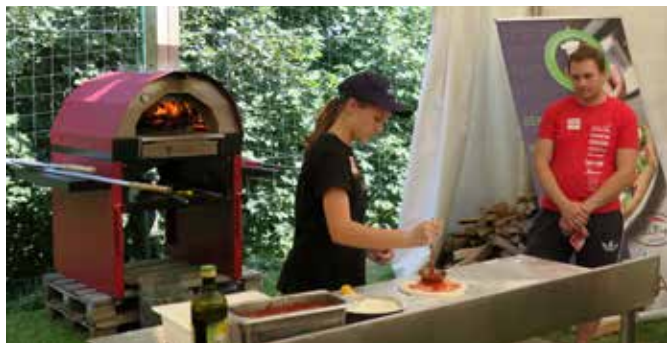
Tekmovanja so se udeležili tudi mladi ljubitelji kuhanja.