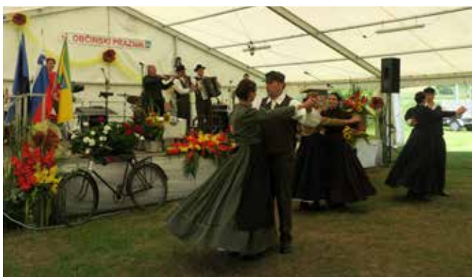
Kak pa je in da fajn bilo, nam je skozi ples in glasbo pokazala folklorna skupina KTD Moščanci