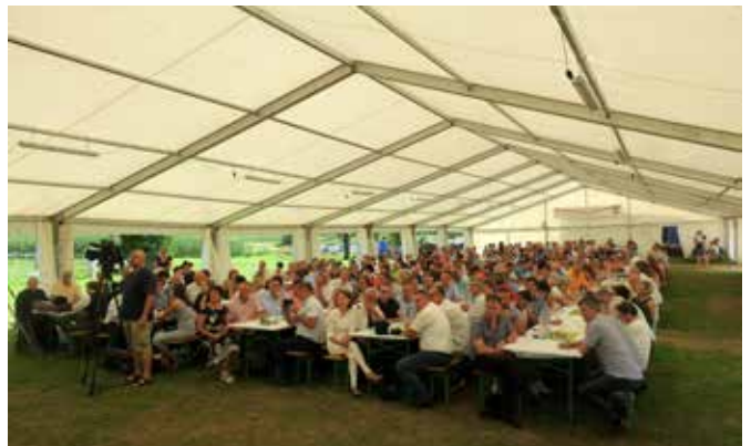
Zbrani na slovesnosti