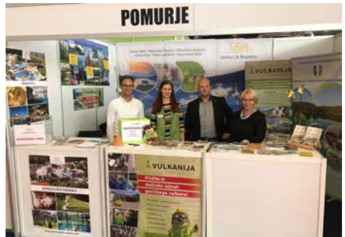
Zavod Vulkanijo promovira na raznih sejmih, MOS Celje.