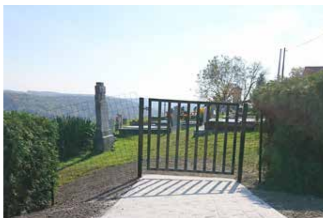
Prehod bo namenjen tudi kot dostop za delovne naprave pri košnji pokopališč.