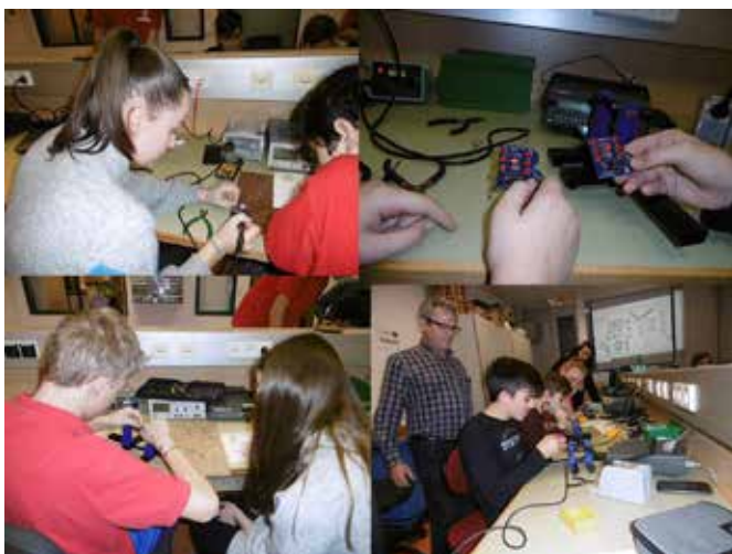
Učenci pri delu.

Projekt Popestrimo šolo omogoča učencem, da sodelujejo na različnih aktivnostih, za katere znotraj rednega pouka nimajo možnosti. Tako smo se odpravili na srednjo tehnično