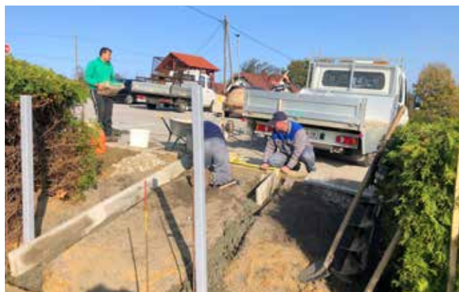
Ureditev prehoda iz parkirišča na pokopališče v Radovcih