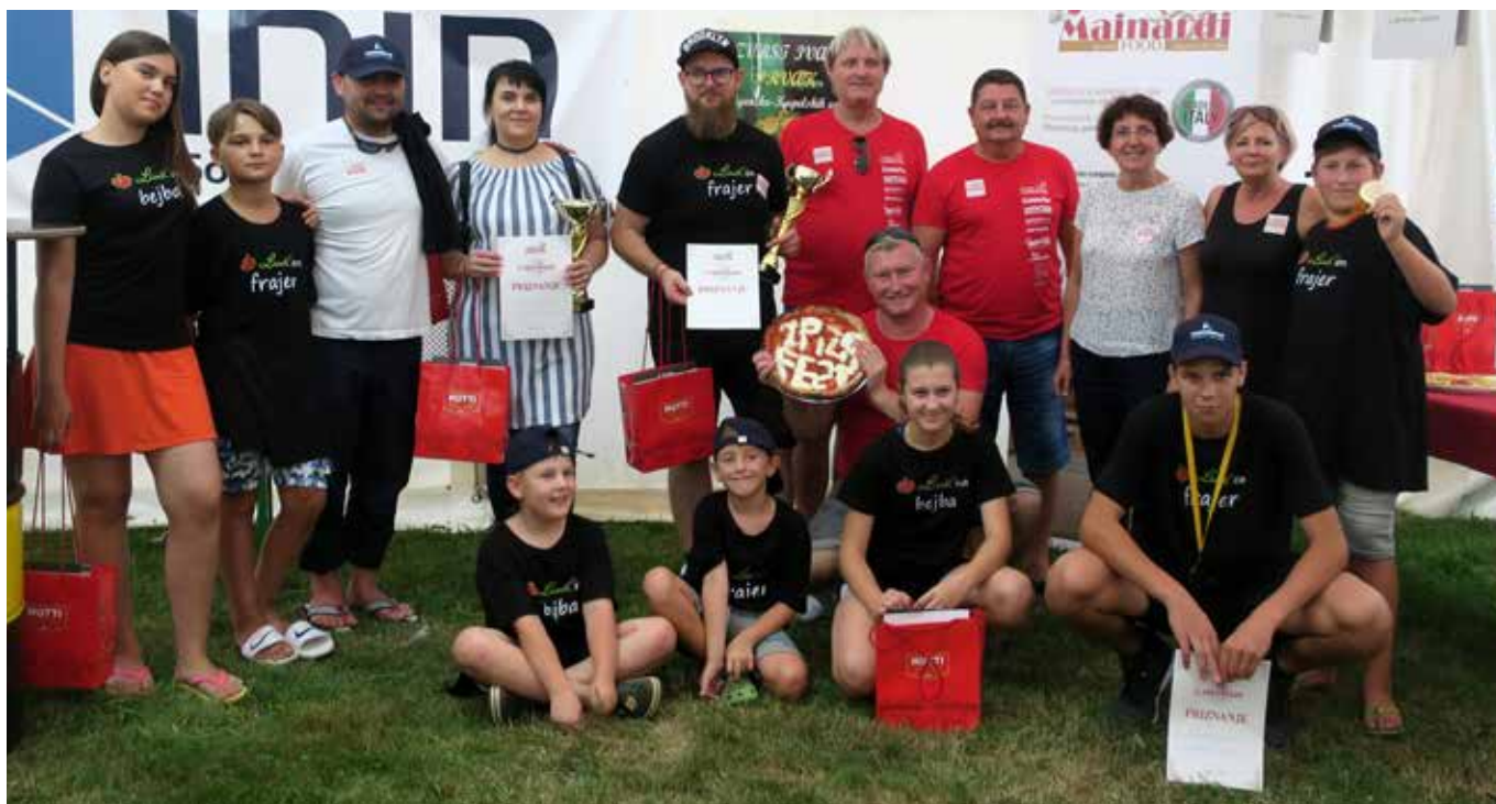
Zmagovalci 1. Fest pice