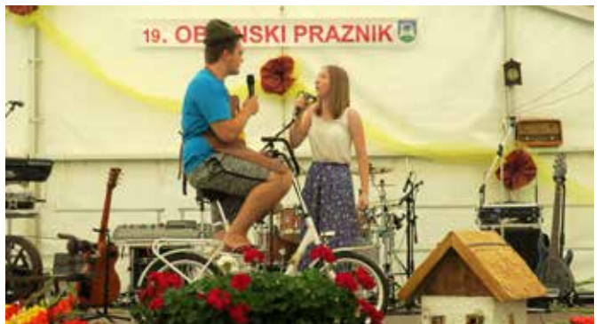
Mladi vaščani iz Motovilcev so pripravili kulturni program