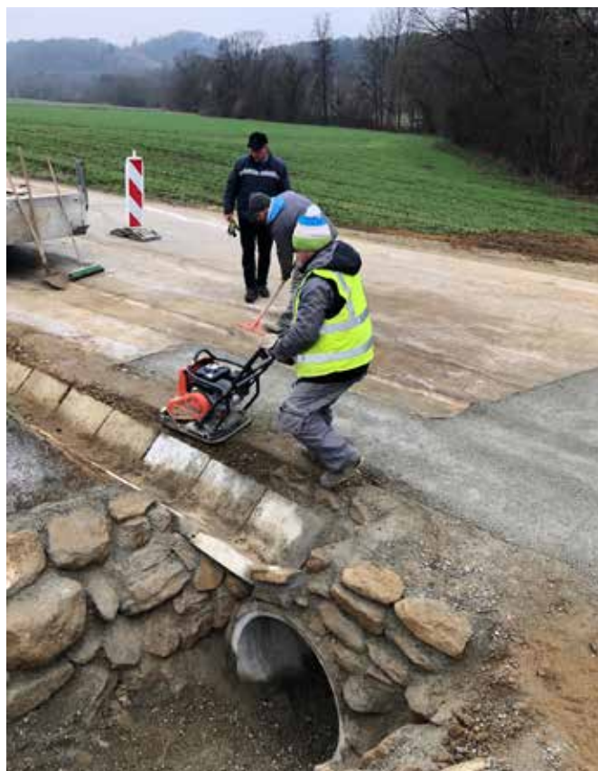
Dela na področju odvodnjavanja na Dolnjih Slavečih