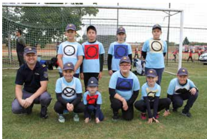
PGD Dolnji Slaveči