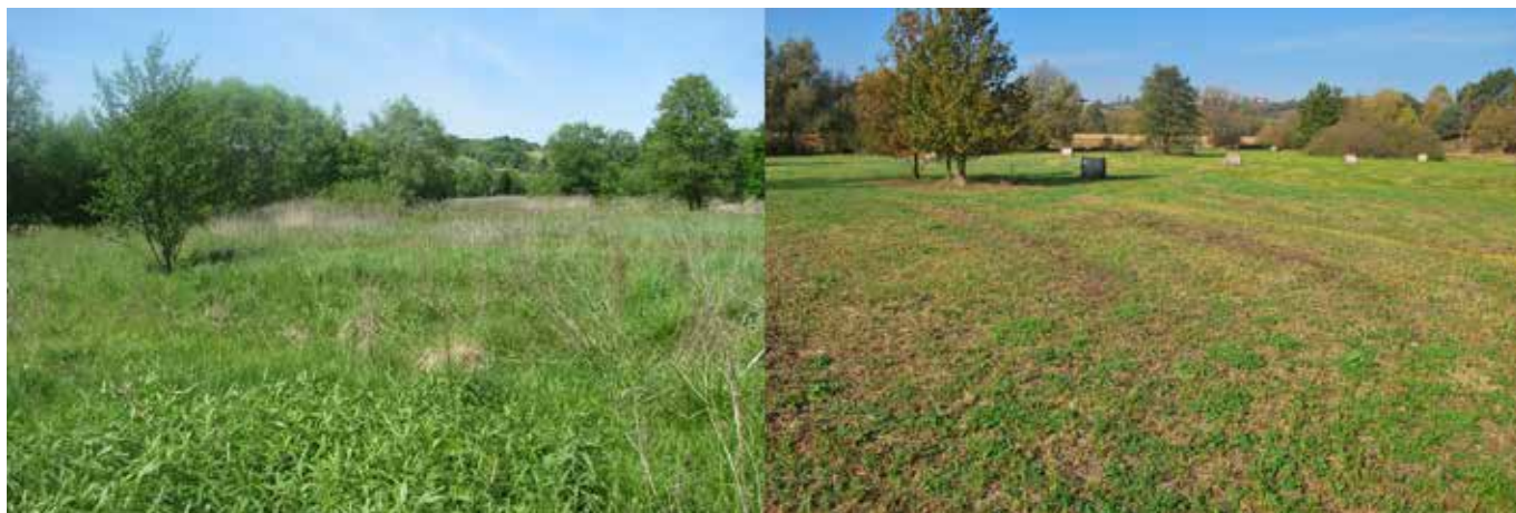
Travnik v Motovilcih leta 2015 in po košnji leta 2019