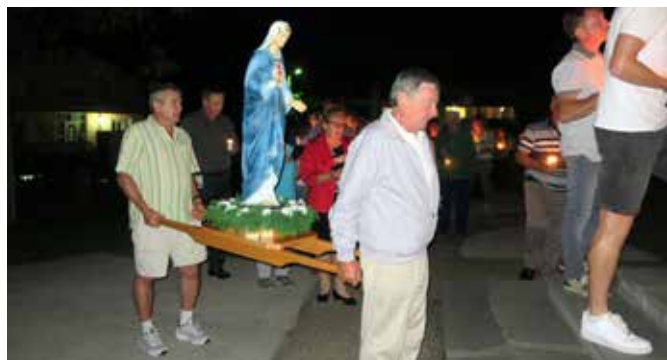
Po sv. maši je bila procesija z lučkami.