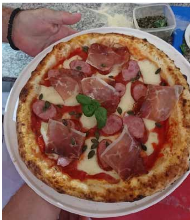
Tekmovalna pica »SLOVENSKA FANTAZIJA«