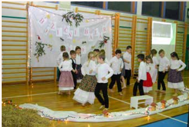
Otroci so skupaj z učitelji pripravili zanimiv kulturni program