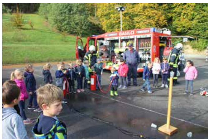
Andreja Fartek

V mesecu oktobru, mesecu požarne varnosti, smo tudi v našem vrtcu namenili pozornost požaru in delu gasilcev ter izvedli nekaj dejavnosti na to temo. Tema je bila za otroke zelo zanimiva, še zlasti to velja za starejše otroke. Delo gasilcev, gasilska vozila in oprema so otrokom zelo zanimivi in jim burijo domišljijo. V vrtec smo povabili tudi naše prostovoljne gasilce. Pokazali so nam, kaj vse uporabljajo gasilci za gašenje požara in kaj rabijo za svojo varnost, zaščitno uniformo. Povzpeli smo se tudi v gasilski avto, poskusili pa tudi ciljati tarčo z vodnim curkom s pomočjo ročne črpalke. Še enkrat se zahvaljujemo gasilcem za obisk!