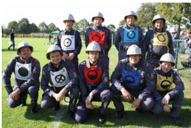
PGD Motovilci člani B

Mladinci so se merili v vaji z ovirami, štafeti z ovirami ter v vaji razvrščanja. Dolnji Slaveči so bili 9., Motovilci pa 13.